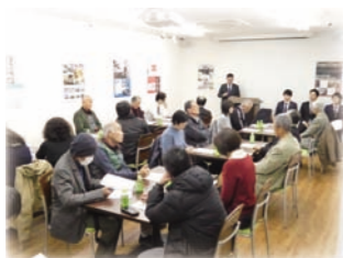
相続対策セミナー 2018/11