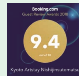
京都アートステイ 西陣捨松