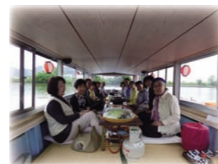
近江八幡水郷巡り 2018/5