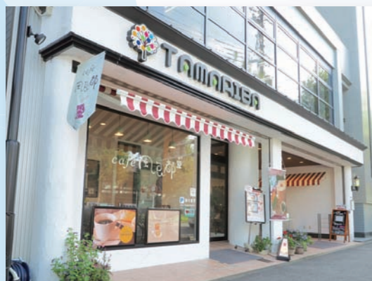
フラットエージェンシーが運営する地域の交流サロン「TAMARIBA（たまりば）」

下鴨店でいえば、周りには下鴨や松ヶ崎など高級住宅街が広がっているので、今まで以上に積極的にファミリー層の募集活動を強化していきます。今期は学生集客は北大路駅前店・京都産業大学前店・左京店が担当し、本店・下鴨店で学生以外の募集を強化していきます。