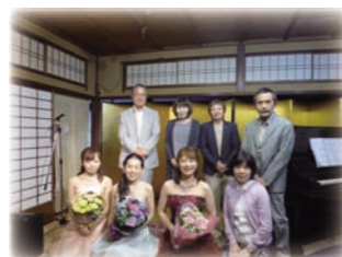
京町家で声楽コンサート 2017/6