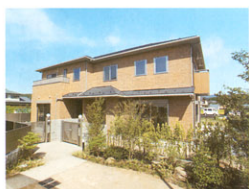
奥の建物は2戸のメゾネット。門は分けられています。