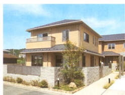
門構えも立派。賃貸に見えないクオリティ。