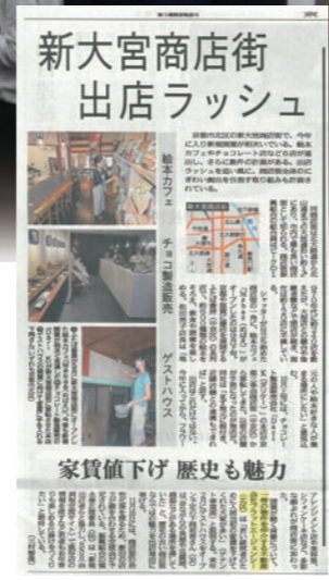
京都新聞 夕刊 2016年10月24日(月) 掲載

▲ 楽しい交流の場 2016年11月16日(水)、TAMARIBAで新大宮商店街の店主を中心とした交流会が行われました。