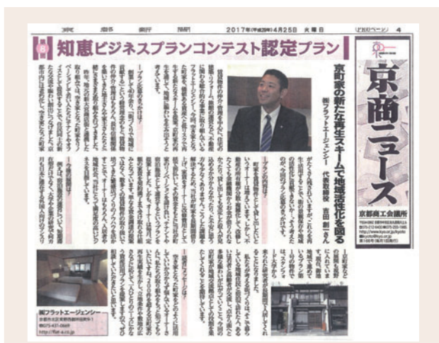
京都新聞 朝刊「京商ニュース」 2017年(平成29年)4月25日(火)掲載

京都商工会議所が主催する、「知恵産業のまち・京都」を推進するため、京都の強みを活かした独創性あふれる応募プランの中から、企業価値を高めて顧客創造を図る知恵ビジネスを認定し、さまざまな支援を行う「知恵ビジネスプランコンテスト」におきまして、当社の『新たな京町家スキームによる地域活性化への取り組み』が認定の榮譽を受けました。