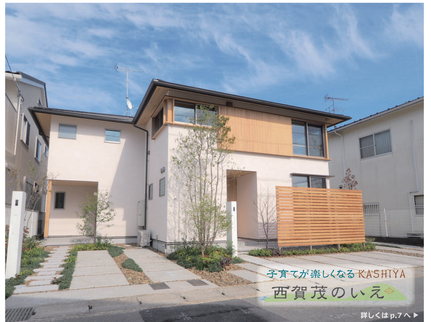
子育てが楽しくなる KASHIYA 西賀茂のいえ