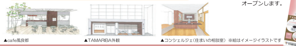
▲cafe風良都 ▲TAMARIBA外観 ▲コンシェルジェ(住まいの相談室) ※絵はイメージイラストです

交流サロン「TAMARIBA」は家主様をはじめ、地域にお住まいの方々が集い、交流し、自由に時間を楽しんでいただくためのコミュニティスペースです。施設内にはカフェコーナー「cafe風良都」を中心に、住まいの相談室、セミナー室や展示ギャラリーとして利用できる多目的空間、図書コーナー、キッズコーナー、理容室がオープンします。