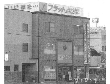
株式会社フラットエージェンシー本店