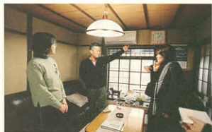
町家という感じを忘れる1階のリビング。

リフォームされましたが、リフォーム物件に入居しているのはまだうだけなんです。中もご覧になってください。「町家に住みたい」と「安全で快適」は両方オツケー。元木 外親は町家そのもののなのに、中に入る「ポイント」？