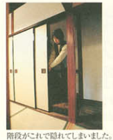
階段がこれでできてしまいました。