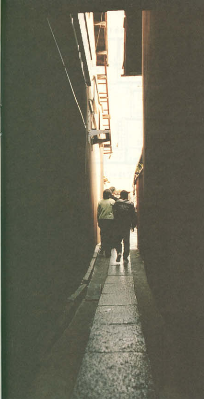
寺町通から長屋に通じる路地。石畳が面白い感じ。

「石畳が最高！ 外親は古い町家そのままだのに、中はリフォームされていて驚きました！」